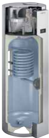
Warmwasser-Wärmepumpe Vitocal 262-A