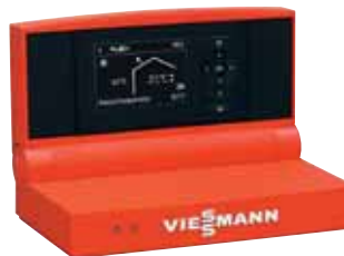
Vitotronic 200 Regelung mit übersichtlicher Menüführung