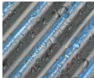
Inox-Crossal-Wärmetauscher aus Edelstahl

Fachbetrieb und Anwender profitieren gleichermaßen von der einfach zu bedienenden Vitotronic Regelung: Das Steuermenü ist logisch und leicht verständlich aufgebaut, beleuchtet, kontrastreich und leicht abzu-lesen. Eine Hilfefunktion informiert im Zweifelsfall über weitere Eingabeschritte. Die grafische Bedienoberfläche dient auch zur Anzeige von Heizkennlinien und Solarertrag.