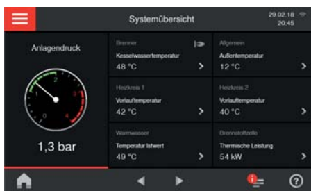
Großes Farb-Touch-Display als zentrale Informationsquelle